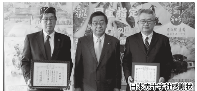
日本赤十字社感謝状