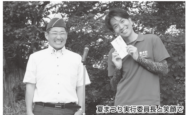
夏まつり実行委員長と笑顔で

今後も、クラブで出来ることを検討しながら、地域のために活動を続けていきたいと思っております。