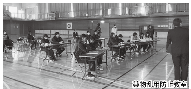
薬物乱用防止教室