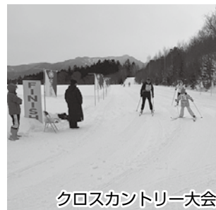
クロスカントリー大会