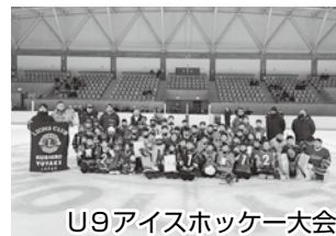
U9アイスホッケー大会

結びに、会員皆さま方の、御健勝と御多幸を祈念してクラブ活動報告の挨拶とさせていただきます。