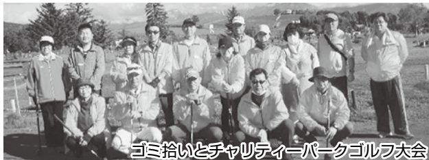
ゴミ拾いとチャリティーパークゴルフ大会