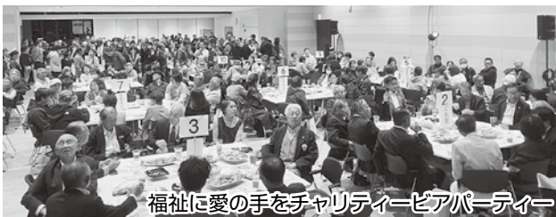
福祉に愛の手をチャリティービアパーティー