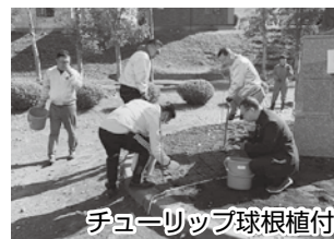
チューリップ球根植付