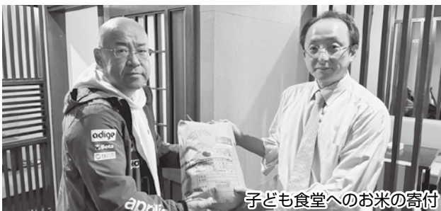
子ども食堂へのお米の寄付