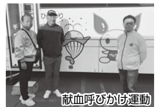
献血呼びかけ運動