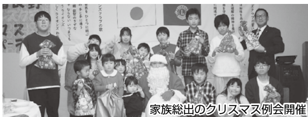
家族総出のクリスマス例会開催