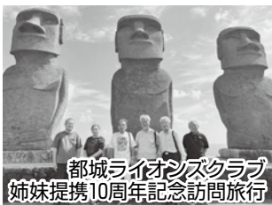
都城ライオンズクラブ 姉妹提携10周年記念訪問旅行