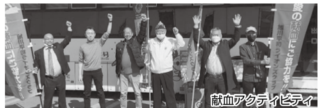
献血アクティビティ