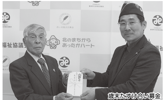
歳末たすけ合い募金