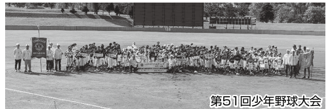
第51回少年野球大会

アクティビティとしては青少年育成事業として昨年9月に第37回少年少女柔道大会、10月には第51回少年野球大会を実施しましたが、旭川柔道連盟、旭川軟式野球連盟との話し合いの中で各大会が、参加する少年少女や父兄からも伝統ある貴重な大会と位置づけられ、大変喜ばれていることが確認され、継続は力なりと再認識するとともに運営を工夫しながら会員の参加意識を高め次年度に繋げてゆく決意を新たにしました。献血アクティビティも大学など会場を増やして実施しているところです。会員が減少傾向の中、長期計画委員会で今後のクラブのあり方を検討しているところですが、クラブ運営の見直しやブラザークラブとの合同例会等の実施で会員相互のコミュニケーションを密にして明るく楽しいライオンズを実践しながら会員増強に努めていきたいと考えている次第です。