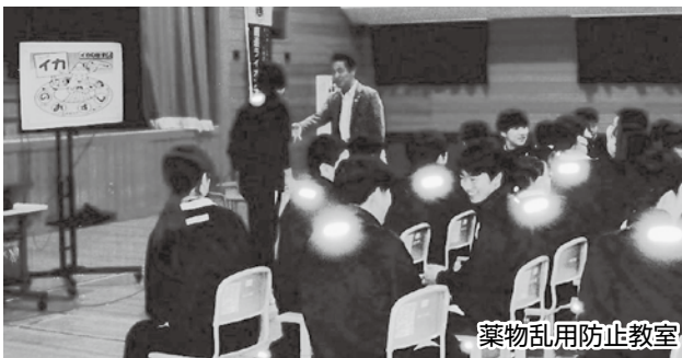
薬物乱用防止教室

活動の中心を青少年育成において活動しています。昨年から帯広さくらライオンズクラブ様と共催で、町内の中学校で「薬物乱用防止教室」を開催しており寸劇のお手伝いで会員が「薬物の売人役」を担っております。鹿追高校生がカナダへの短期留学の際、知ったことで実行委員長を務めている「Terry Fox Run」のお手伝いをしております。道内では札幌と鹿追だけで開催されており第 3 リジョンの各クラブへもご案内しており、他クラブの会員さんにも参加頂いております。その他継続しております活動は、交通遺児募金、地元少年野球チーム「スリーエスユナイテッド」の支援、図書館のライオンズ文庫への図書購入費贈呈、歳末助け合い募金への協力、新入学児童への文房具贈呈等の他に労力奉仕として野生大麻駆除、夏、秋、冬の交通安全旗波作戦参加、4 月上旬の新入生の交通安全指導等、小さいですが地域密着の活動を続けております。