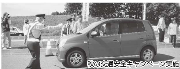
秋の交通安全キャンペーン実施

9月には「秋の交通安全キャンペーン」10月には「ゴミ拾いとチャリティーパークゴルフ大会」12月には、「家族総出のクリスマス例会」等、会員相互の友好を深めております。又、今期は、会員増強にも力を入れ、7月・8月・9月と連続3名の新会員をお迎えしました。今後の活躍に期待致します。