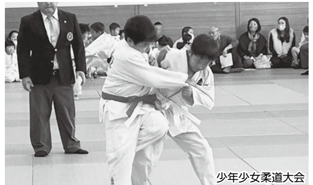
少年少女柔道大会