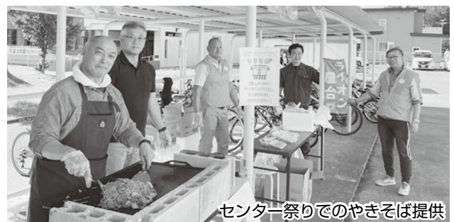
センター祭りで焼きそば提供