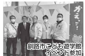
釧路市こども遊学館イベント参加